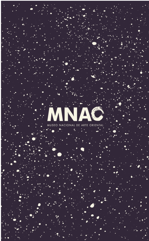
Carta 008 - A (dorso)