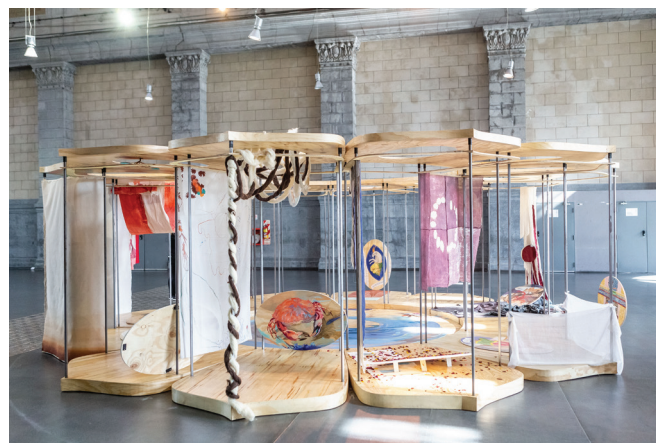
Catalina León Un zodiaco posible (obra en construcción) 2019, instalación y proyecto participativo. Pieza de madera y hierro intervenida con pinturas y telas bordadas. Vista desde Cáncer.

En sus obras no hay respuestas acabadas. Hay capas, texturas de sentido y contrasentido. Materiales sobre los que se imprimen rastros de una conversación siempre inconclusa acerca de los vínculos humanos y los procesos de transformación, que se acerca a una fiesta o a un rito privado atravesado por la época, el contexto. Encuentra en la práctica de taller la posibilidad de preparar la mente para explorar terrenos inciertos: pensar sin pensamientos, rasgar la lógica de los discursos establecidos, del cálculo y la especulación a través de una experiencia física e intuitiva. Su trabajo gravita en torno a un permanente intento por llevar su relato personal hacia un lugar abstracto, donde la narración se derrite, transformándola en una matriz.