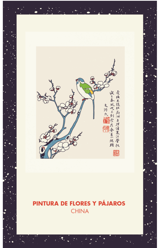
Carta 008 - A (cara)