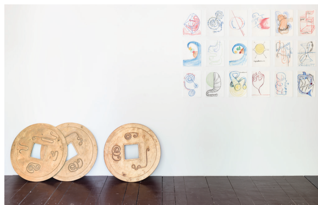
Eduardo Navarro Hydrohexagrams 2017 Monedas de bronce, dibujos (pastel sobre papel), video instalación. ø 65 cm x 0.5 cm (monedas), 20 min (video), dibujos de dimensiones variables.

Posee dentro de su obra dibujos realizados en A4 concebidos como un ejercicio intensivo de trabajo: llevar imágenes mentales aleatorias al papel. El propósito es congelar una unidad de espacio-tiempo y construir una grilla mental en la que los dibujos no valen por su resultado cualitativo e individualizado, sino por el efecto de su acumulación. Así se busca estados de saturación, agotamiento y trance en los que se puede vislumbrar la posibilidad de lo nuevo por más extraño que esto sea. Las maneras, a veces sutiles, otras brutales, en las que interviene, transforma o se comunica con el entorno ponen en funcionamiento ambientes en los que las diferencias entre lo real y lo ficticio se tensan, las diferencias entre humano y animal pierden densidad y entonces despuntan formas de vida y de percepción alternativas. En este sentido, sus trabajos no buscan estudiar objetos sino entrar en comunión con ellos.