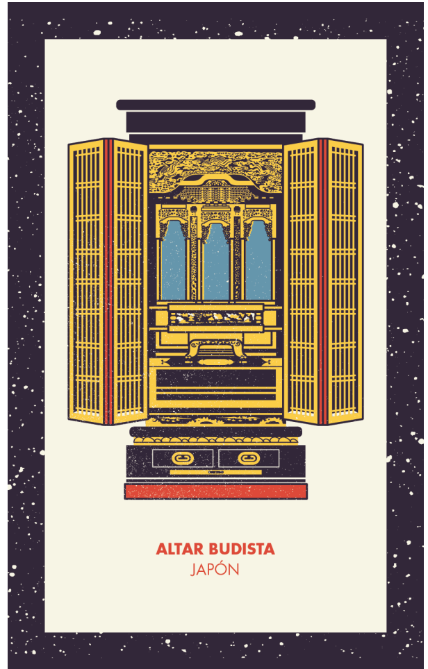
Carta 002 - A (cara)